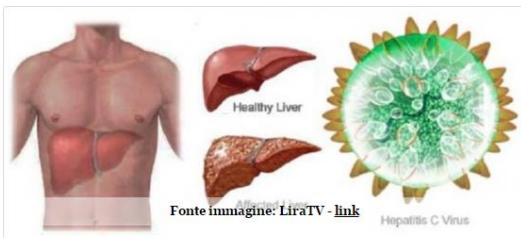
L'epatite C è un male

Chi ti Paga di Più è Sempre Orodei. Siamo in Via dei Colli Albani 40. orodeibancometalli.it/Roma